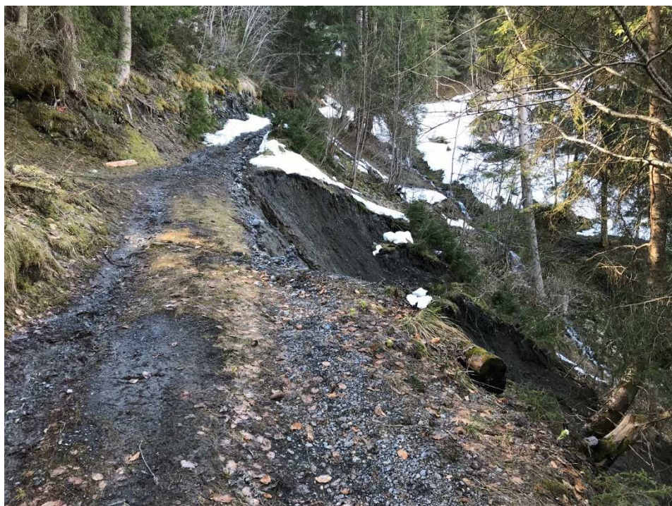
Abgerutschter und fauler Holzkasten

Der Gemeindevorstand beantragt der Gemeindeversammlung den Bruttokredit von Fr. 205'000. — zu genehmigen.