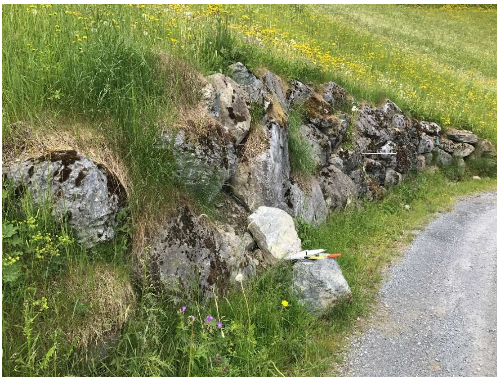
Zusammenbrechende Blocksteinmauer (Waldweg Brandegga)

Der Gemeindevorstand beantragt der Gemeindeversammlung den Bruttokredit von Fr. 91'500. — zu genehmigen.