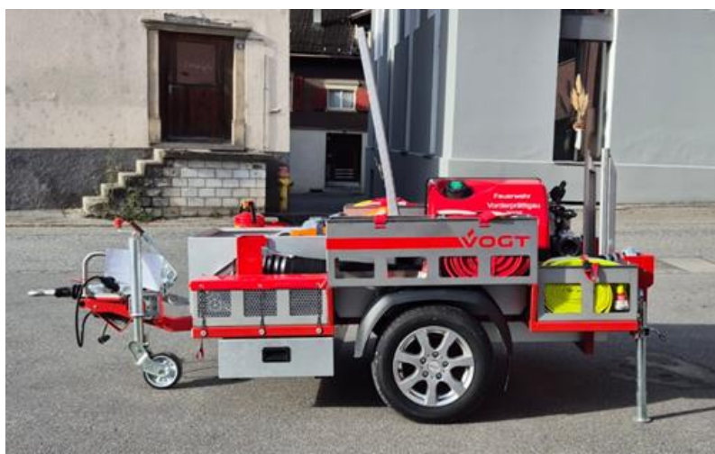
Motorspritze Typ 2 in Anhänger Ausführung

Die vorhandenen Motorspritzen des Typs 2 stammen grösstenteils aus den 1960er-Jahren, deshalb werden gestaffelte Ersatzbeschaffungen als sinnvoll erachtet. Für den Standort Valendas ist eine Motorspritze in Anhänger Ausführung vorgesehen.